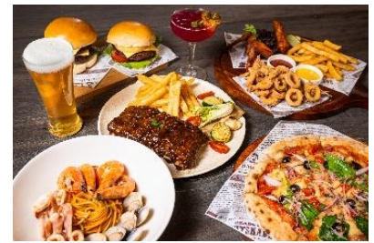
MORE FUN 形象圖

「MORE FUN，一口咬下歡樂不間斷」- 人氣義式餐廳-默爾 pasta&pizza 全新進化，結合餐廳主廚自製的美式漢堡、手作三明治與美式拼盤，推出二代概念店!輕鬆舒適的空間，最適合三五好友聚會，一起喝啤酒聊天、看運動賽事、夜晚微醺放鬆、享受滿滿的潮流氛圍，每一口都為歡聚加分～來這裡，吃飯變成一件 SO FUN 的事!! -